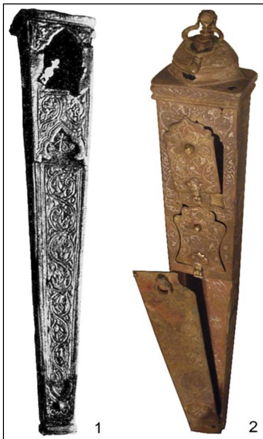
Рис. 2. Пеналы (каламданы). Медный сплав. Государственный Эрмитаж (Санкт-Петербург): 1 – [10, рис. 43]

Более полно сохранился иранский каламдан подобной конструкции нач. XIII в. (рис. 2, 2). Он сделан тоже из пластин медного сплава, украшен гравированным орнаментом, инкрустирован серебром. Изготовил его предположительно мастер Мухаммад ибн Футух (ГЭ инв. № ИР-2373).